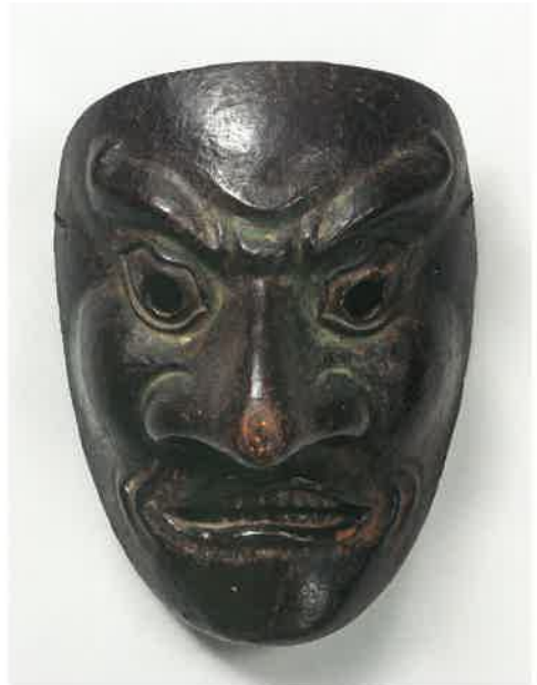
《参考》重文 貴徳面 平安時代

もくぞうぶがくめん きとく 木製彩色 面長 21.3cm 面幅 16.0cm 1面 南北朝時代