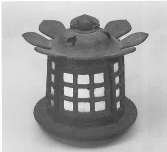
ちゅうてつとりとうろう 県文 鑄鉄釣燈籠 1基 総高31.1cm 江戸時代

作者の板谷波山(1872～1963)は、端麗な姿と滋潤な彩色、秀れた薄肉の彫刻文様で知られ、我が国陶芸界の第一人者として典雅な意匠作品を数多く発表した。理想とする作品制作のためには一切の妥協を許さず、昭和28年、陶芸家として初の文化勲章を受章した人物として知られている。