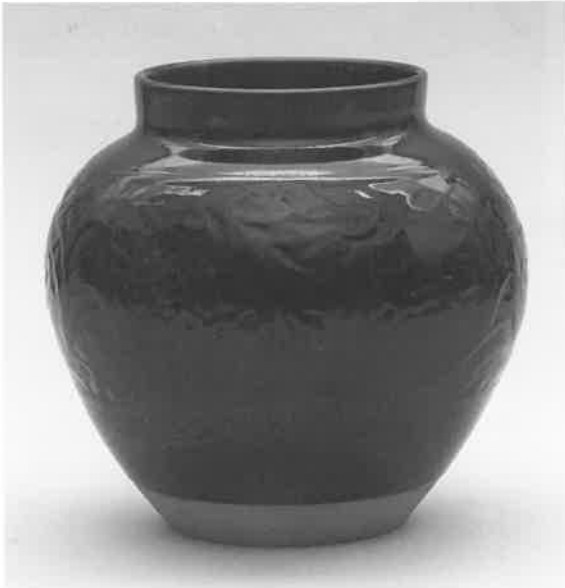
くろあめじ かびん 黒飴磁花瓶 板谷波山作 1口 現代 高32.3cm 口径19.8cm

裾部は土を見せ、残る部分は全体に鉄釉をかけ、薄肉の葡萄文様を胴全体に施した広口の壺である。全体の姿は肩も張らず端正で、鉄釉のしっとりとした肌あいは、黒飴磁の名にふさわしいものである。本器「黒飴磁花瓶」の名称は、作者自身の命名による。