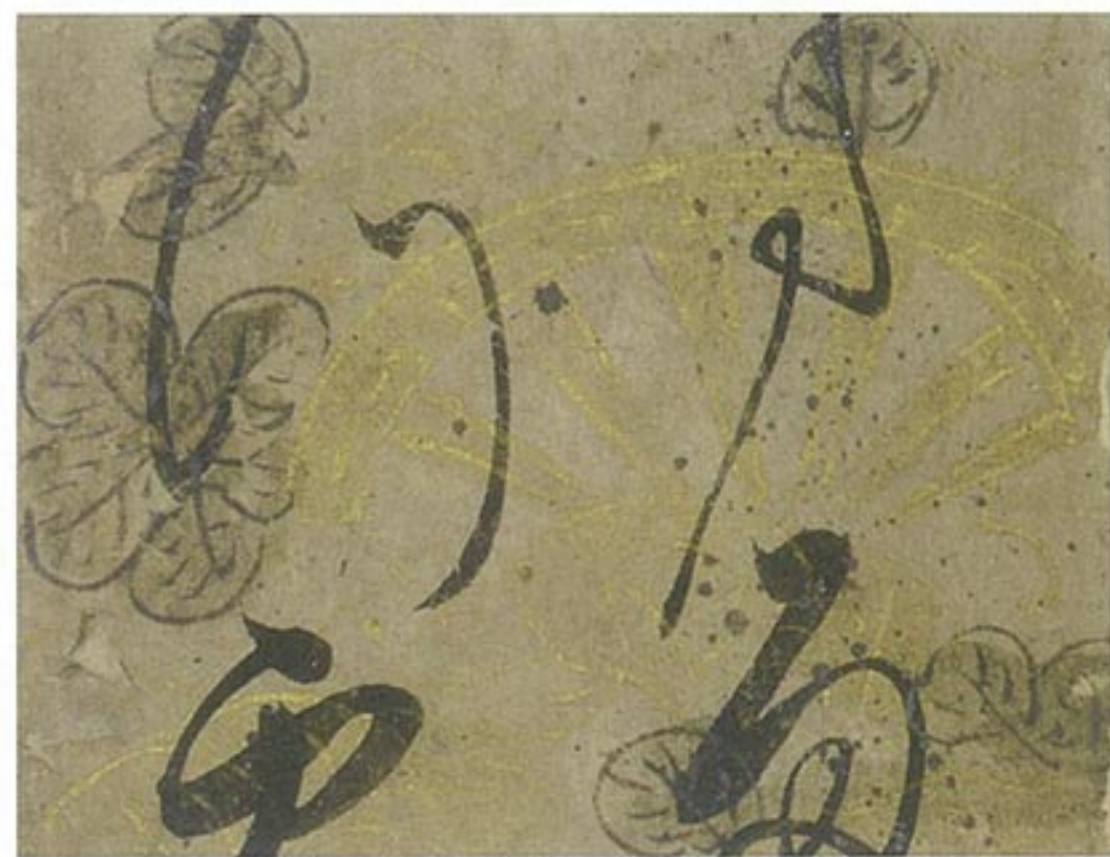
後奈良天皇筆和歌短冊 (部分)

伝 後奈良天皇 ごならてんのう 筆和歌短冊 (向かって左) 1枚 室町時代 伝 後西天皇 ごさいてんのう 筆和歌短冊 (同右) 1枚 江戸時代 長 39.7cm 上幅 4.2cm